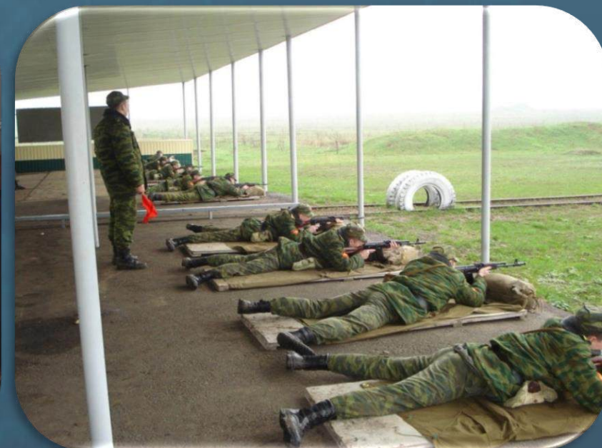
База для проведения учебных стрельб