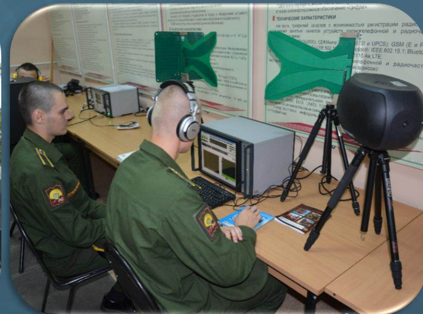
Техника специальной связи