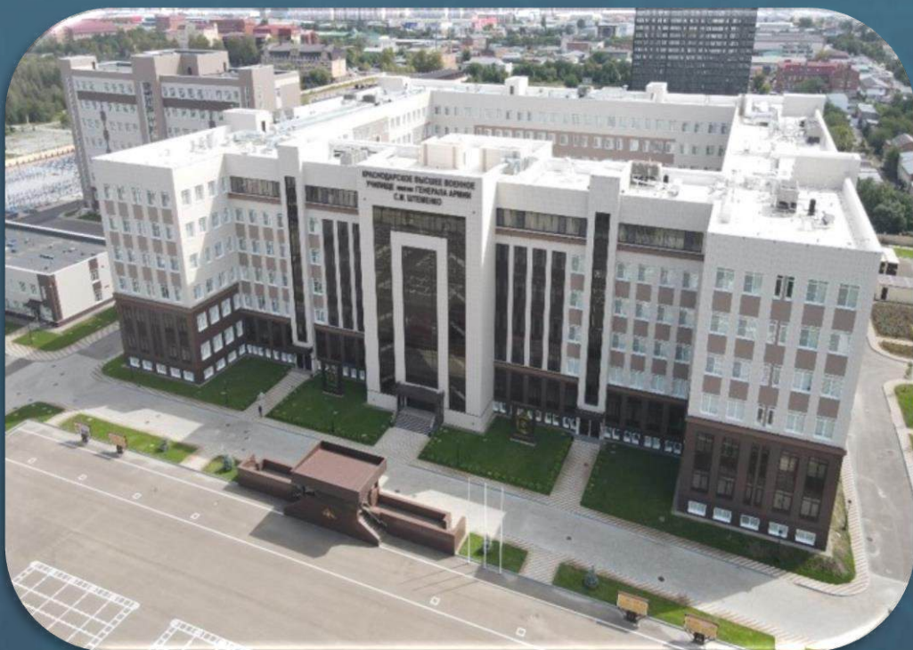
Учебный корпус № 1