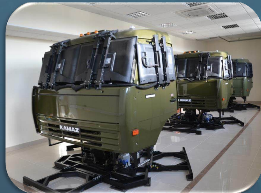
Учебный тренажер «КАМАЗ»